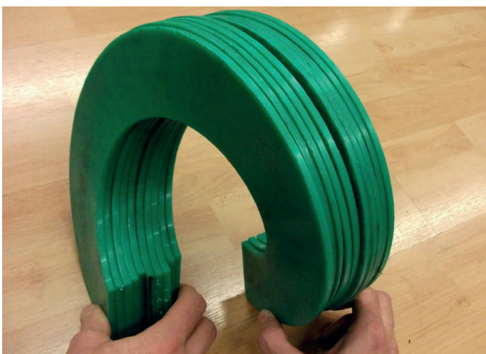
Espiras de polietileno PE-1000 blanco, negro o verde para apoyo de sinfines y limpieza de canales.