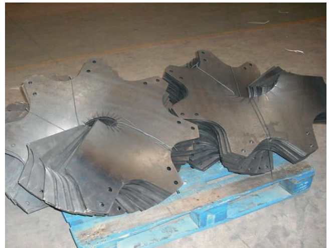
Con dientes en acero, acero antidesgaste e inoxidable.